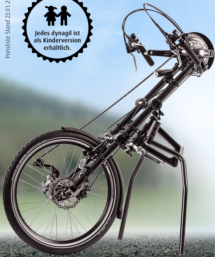
Die gezeigte Abbildung enthält Sonderausstattung