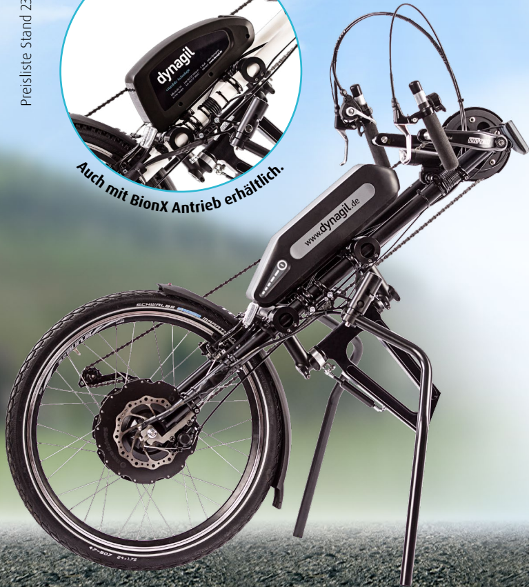
Die gezeigte Abbildung enthält Sonderausstattung